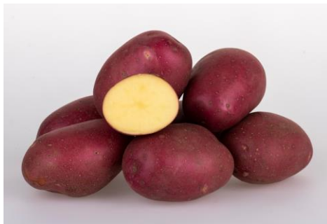
Romanze x Laura