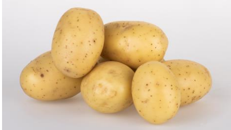
Merida x 96-MBY-8